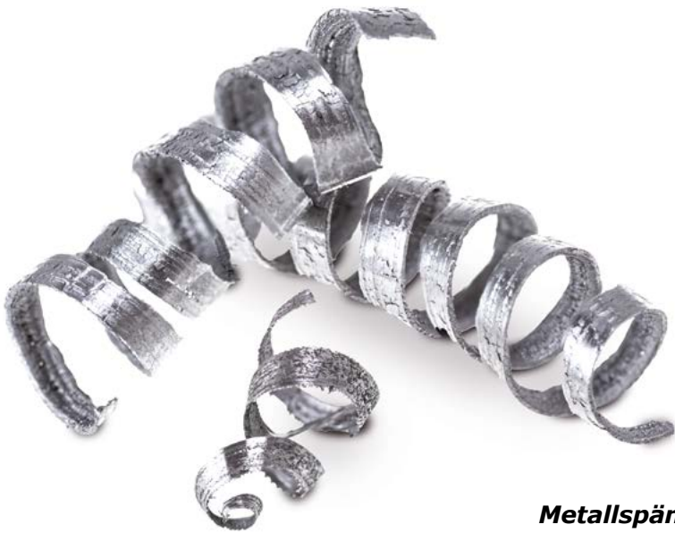
Metallspäne ( metallum astulae )